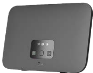
Speedport Smart 4

Router und 5G-Empfänger kombinieren Mobilfunk mit bis zu 300 MBit/s mit der vorhandenen Bandbreite aus dem Festnetz.