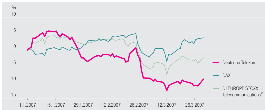
Performance T-Aktie gegen europäische Wettbewerber 2.1.-31.3.2007