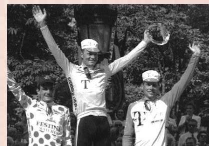
Doppelsieg bei der Tour de France: Bjarne Riis (Mitte), Jan Ullrich (rechts)

Aus heutiger Sicht erwartet die Deutsche Telekom für das laufende Jahr 1997, daß sich die positive Geschäftsentwicklung fortsetzen wird. Dies wird durch die Umsatzentwicklung der ersten drei Monate bestätigt. Investitionsprogramm, Personalanpassung und Schuldenabbau entwickeln sich gemäß den Planungen. Der bisherige Geschäftsverlauf läßt im Vergleich zum Vorjahr eine Ergebnissteigerung erwarten.