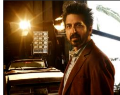
Ray Romano als Rick Moreweather („Alle lieben Raymond“, „The Big Sick“)