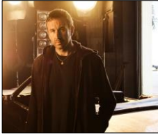
Chris O'Dowd als Miles Daly („Die Insel der besonderen Kinder“, „Brautalarm“, „Moon Boy“)