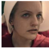
Elisabeth Moss als Desfred („Mad Men“, „Top of the Lake“)