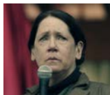
Ann Dowd als Tante Lydia („The Leftovers“, „Compliance“)