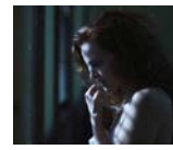
Madeline Brewer als Janine („Orange Is the New Black“)