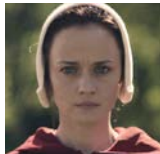
Alexis Bledel als Desglenn („Gilmore Girls“)