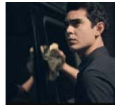
Max Minghella als Nick Blaine („The Social Network“)