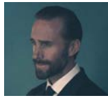
Joseph Fiennes als Kommandant („Shakespeare in Love“, „American Horror Story“)